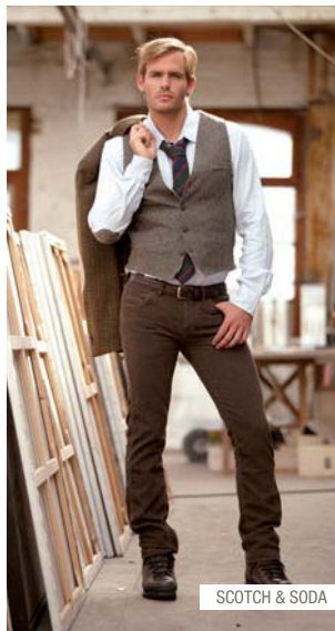
SCOTCH & SODA

SCHRIJF U IN VOOR DE NEWSLETTER EN MAAK KANS OP EEN WAARDEBON VAN €50